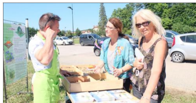
Le comité de fleurissement était présent.

Au cours de la Journée du bien-être, où plus de 50 activités étaient à découvrir, des amateurs de jardin ont écouté les conseils de Pascal Gerbet, maître composteur.